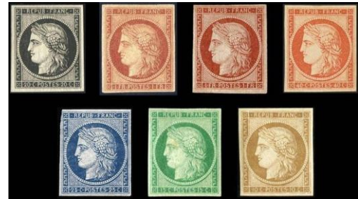
1 er timbre poste français : le Cérès noir de 1849

En cette fin du 19 ème siècle l'activité économique est en plein essor, la création de la gare de Chacé-Varrains, l'importance du commerce des vins, les correspondances facilitées par l'emploi du timbre-poste vont pousser les deux communes à créer un bureau de poste.