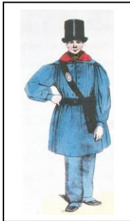
1 ère tenue du facteur rural en 1835

La levée s'effectue tous les deux jours, leur entretien est à la charge des directeurs des postes qui doivent veiller à ce qu'elles soient repeintes régulièrement.