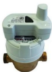
Compteur télé relève